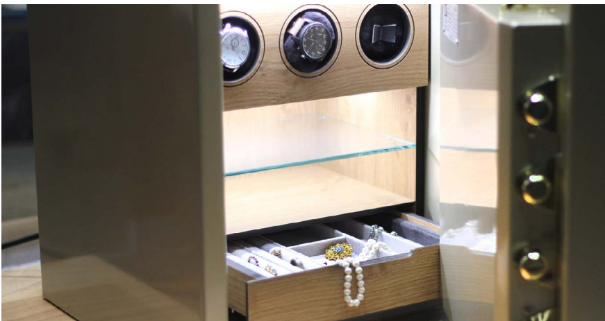
Präzisere Vorgaben, zum Beispiel was die Aufbewahrung von Wertsachen und Bargeld betrifft.

und Bargeld präziser fest. Neu ist explizit auf die anfallenden Gebühren zu achten. Weiter werden die zulässigen Anlagemöglichkeiten entsprechend den unterschiedlichen Bedürfnissen erweitert. Für die mit der Vermögensverwaltung beauftragten Personen und die Betroffenen selber werden die Regelungen besser nachvollziehbar und die Handhabung wird einfacher. ■